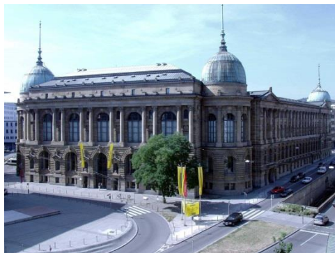
Abbildung 1: Veranstaltungsort Außenansicht, Bildquelle: Haus der Wirtschaft Baden-Württemberg