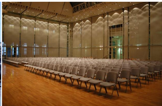
Abbildung 2: Veranstaltungsort König-Karl-Halle