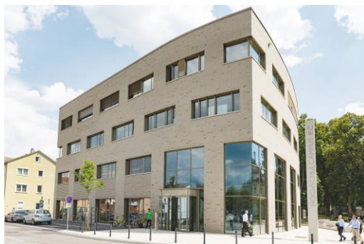
Das IFC im Herzen der Stadt.